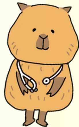
公式マスコットキャラクター かじぼん